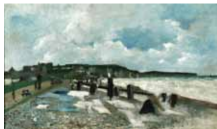
N°4 Pierre Isidore Bureau , Plage de Dieppe , huile sur toile, Château-Musée de Dieppe