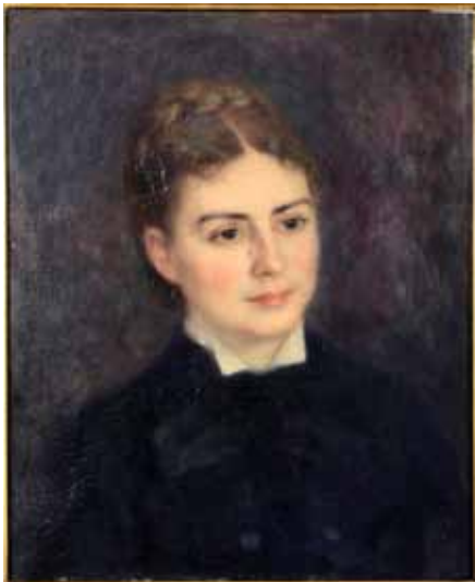
N°9 Auguste Renoir , Portrait de Madame Paul Bérard , 1879, huile sur toile, Château-Musée de Dieppe