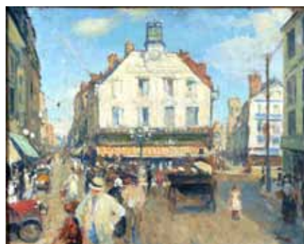
N°6 Jacques-Émile Blanche , La place du puits salé , vers 1929, Huile sur carton, Château-Musée de Dieppe