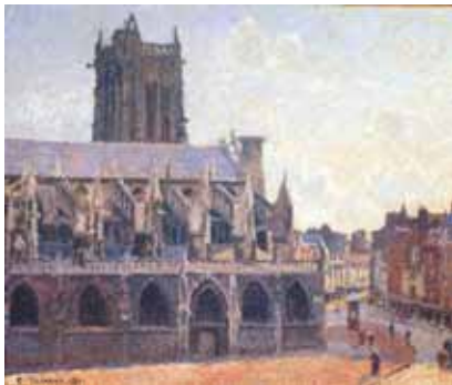
L'église Saint-Jacques à Dieppe, soleil, matin, 1901

Les vues du port seront le sujet de son second séjour à Dieppe, un an plus tard.