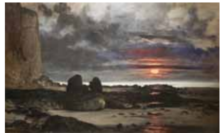
N°8 Karl Daubigny , Falaises au soleil couchant , huile sur toile, Château-Musée de Dieppe