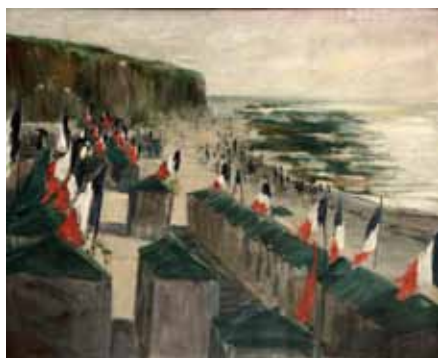
N°5 Henri Charles Guérard , Le 14 juillet sur une plage normande ou Fête Nationale , huile sur toile, Château-Musée de Dieppe