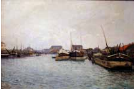
N°7 Alfred Sisley , Les péniches , 1870, huile sur toile, Château-Musée de Dieppe