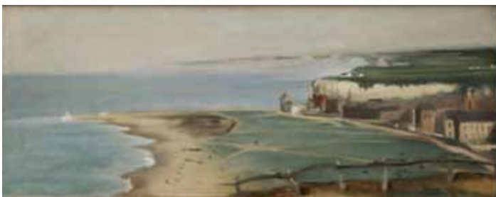
N°11 Eva Gonzalès , Plage de Dieppe vue depuis la falaise Ouest , huile sur toile, Château-Musée de Dieppe