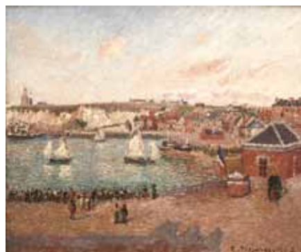
N°2 Camille Pissarro , Vue de l'avant port de Dieppe , 1902, huile sur toile, Château-Musée de Dieppe