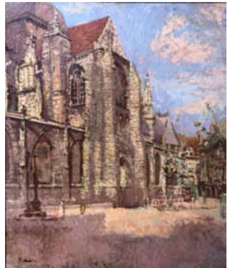
N°10 Walter Sickert, L'église Saint-Jacques, portail sud, 1907-1908, huile sur toile, Château-Musée de Dieppe