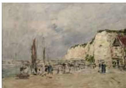
N°3 Eugène Boudin , Les falaises du Pollet à Dieppe , 1896, huile sur toile, Château-Musée de Dieppe